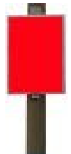
DIN A1 59 x 84 cm