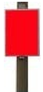
DIN A1 59 x 84 cm